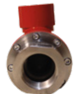
CODO GIRATORIO 1.25_90° 6000PSI ROSCADO NPT