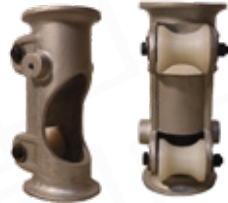
GUÍA DE MANGUERA DEL CARRETE