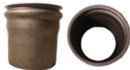
ACOPLE RINGLOCK HEMBRA MODELO AQUATECH