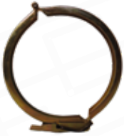
ABRAZADERA 8 TIPO C MODELO AQUATECH