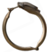
ABRAZADERAS 8 MODELO VAC-CON