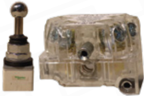
JOYSTICK CARRETE 9001K CON CONTACTORES