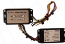
MODULO DE ACELERACION AQUATECH