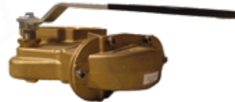
VALVULA DESCARGA 6 EQUIPO HIDROJET