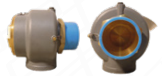
ALIVIO DE VACIO