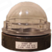
VISOR DE NIVEL DE LLENADO