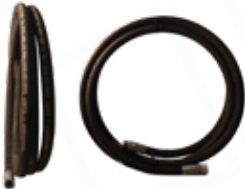
MANGUERA LIDER R17-R12