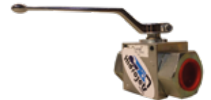
VALVULA ESFERICA 2 VIAS PARA VAC-CON

Somos la única tienda física en el Perú por tener en stock repuestos utilizados en equipos hidrojets contando desde un interruptor a una bomba alta presión y todos los accesorios de uso constante en el trabajo de limpieza alcantarillado con equipos hidrojets, minijets y/o equipos de succión.