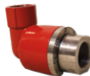
CODO GIRATORIO 1.25_90° 6000 PSI