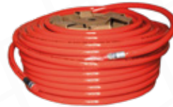
MANGUERA ALTA PRESIÓN 1", 2500 PSI, 500 PIES, 150 M. MARCA PIRANHA